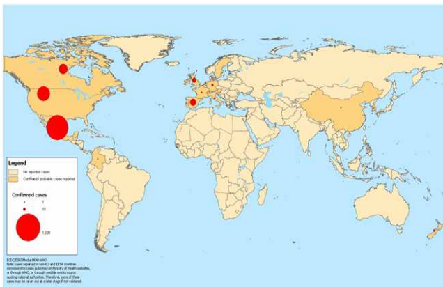
Mapa 1. Casos confirmados acumulados de gripe A/H1N1 a nivel mundial (fuente ECDC. 05/05/09 8:00h)