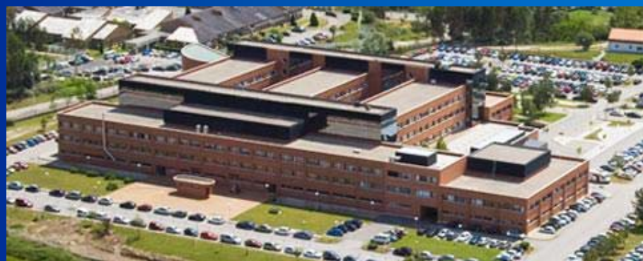
Hospital de Sierrallana