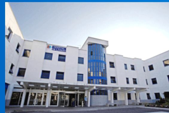
Hospital de Laredo