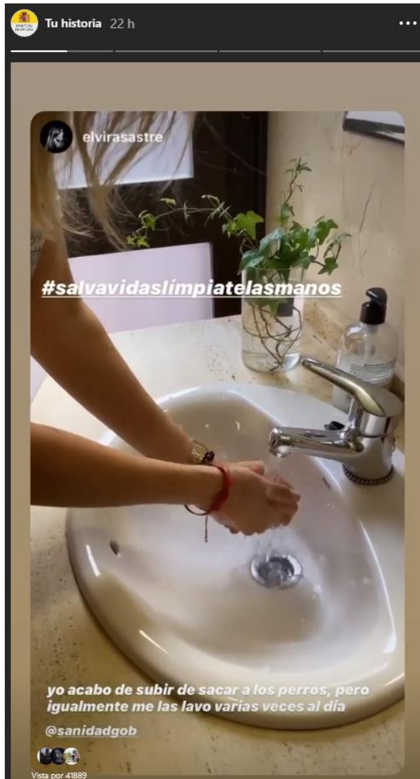
Elvira Sastre, 429.000 seguidores