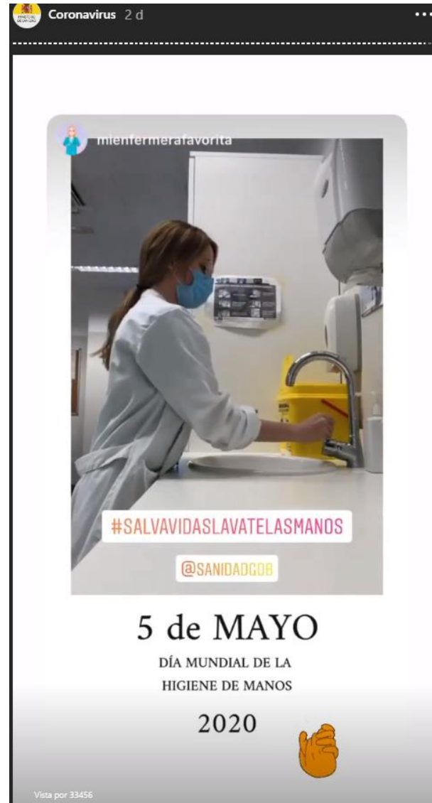
Mi enfermera favorita, 72.900 seguidores