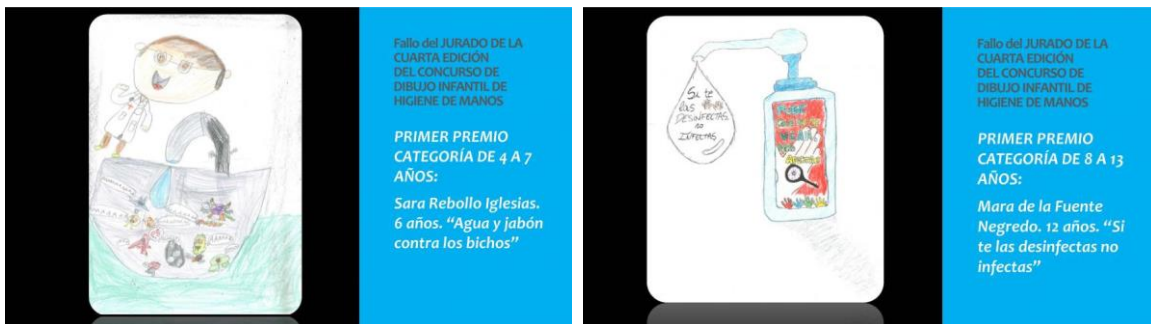
Imagen de los dibujos premiados en cada categoría

Más imágenes del resto de dibujos premiados en la noticia publicada en web http://www.comunidad.madrid/noticias/2019/05/10/sanidad-falla-premios-iv-concurso-dibujo-infantil-higiene-manos