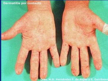
Dermatitis de contacto

Las manos del personal sanitario están expuestas a numerosas agresiones. Recuerda que son nuestras más importantes herramientas de trabajo: ¡Cuídalas!