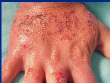
Dermatitis por alergia a látex

Las manos del personal sanitario están expuestas a numerosas agresiones. Recuerda que son nuestras más importantes herramientas de trabajo: ¡Cuídalas!